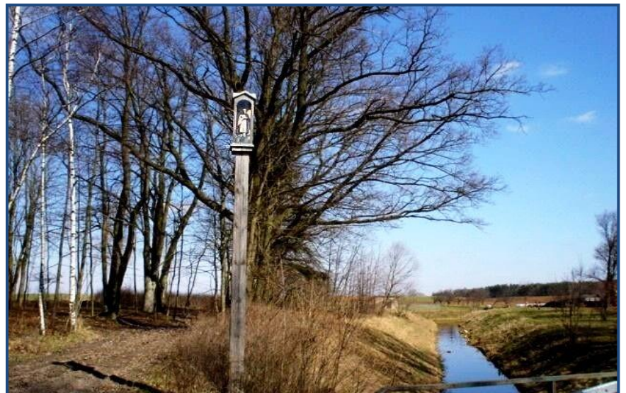
Kapliczka św. Jana Nepomucena w Turówce, fot. 2005