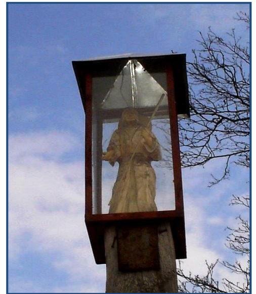
Kapliczka św. Jana Chrzciciela w Biernatkach, fot. 2005