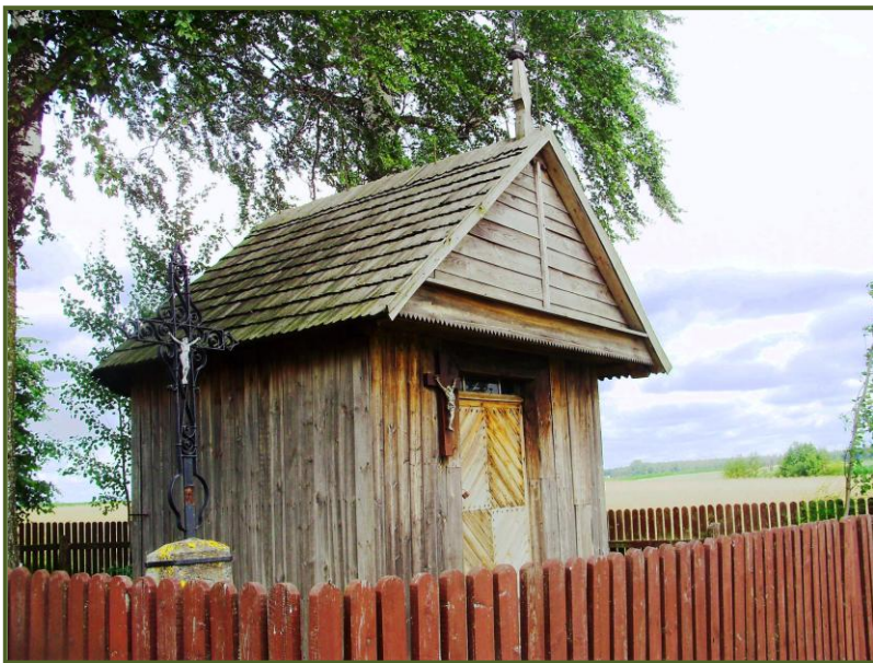
Kaplica i kuty krzyż w pazdurze, fot. 2011