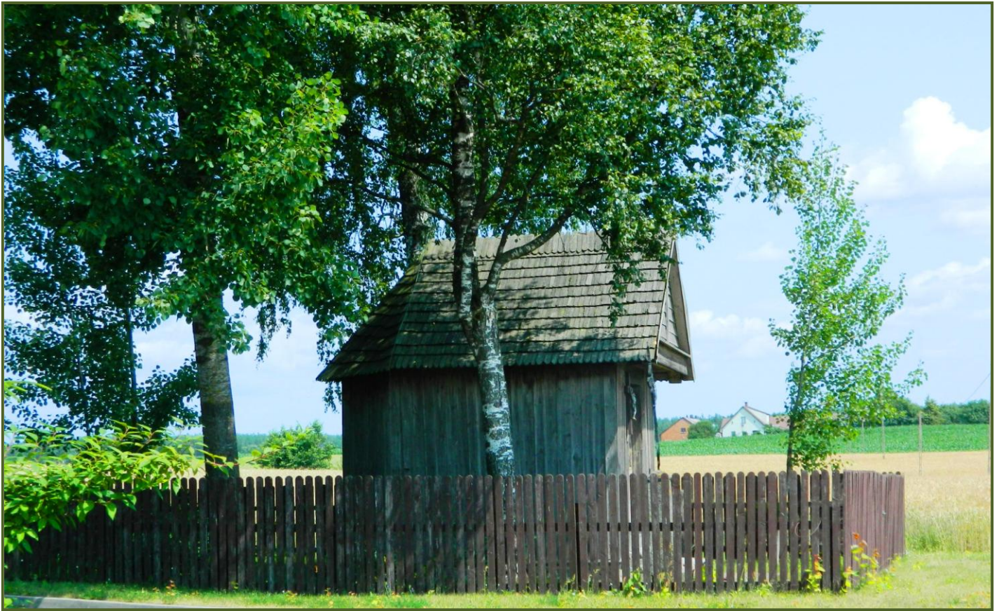
Drewniana kaplica przydrożna z 1859 roku w Żarnowie Drugim, fot. 2013